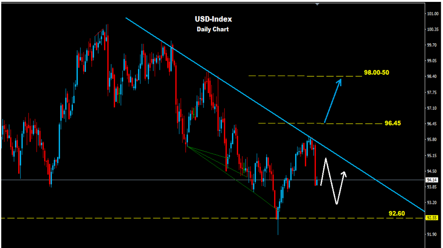
مؤشر الدولار - الإطار الزمني 1 يوم

مدى التداول اليومي يظهر مستويات مقاومة أولية عند أسعار (95.95) حيث وفوق هذه المستويات فانها قد تكون المؤشر الأول على قابلية مزيد من الارتفاع لاختراق مستويات المقاومة (96.45)