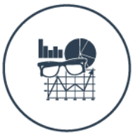
US NON FARM PAYROLLS