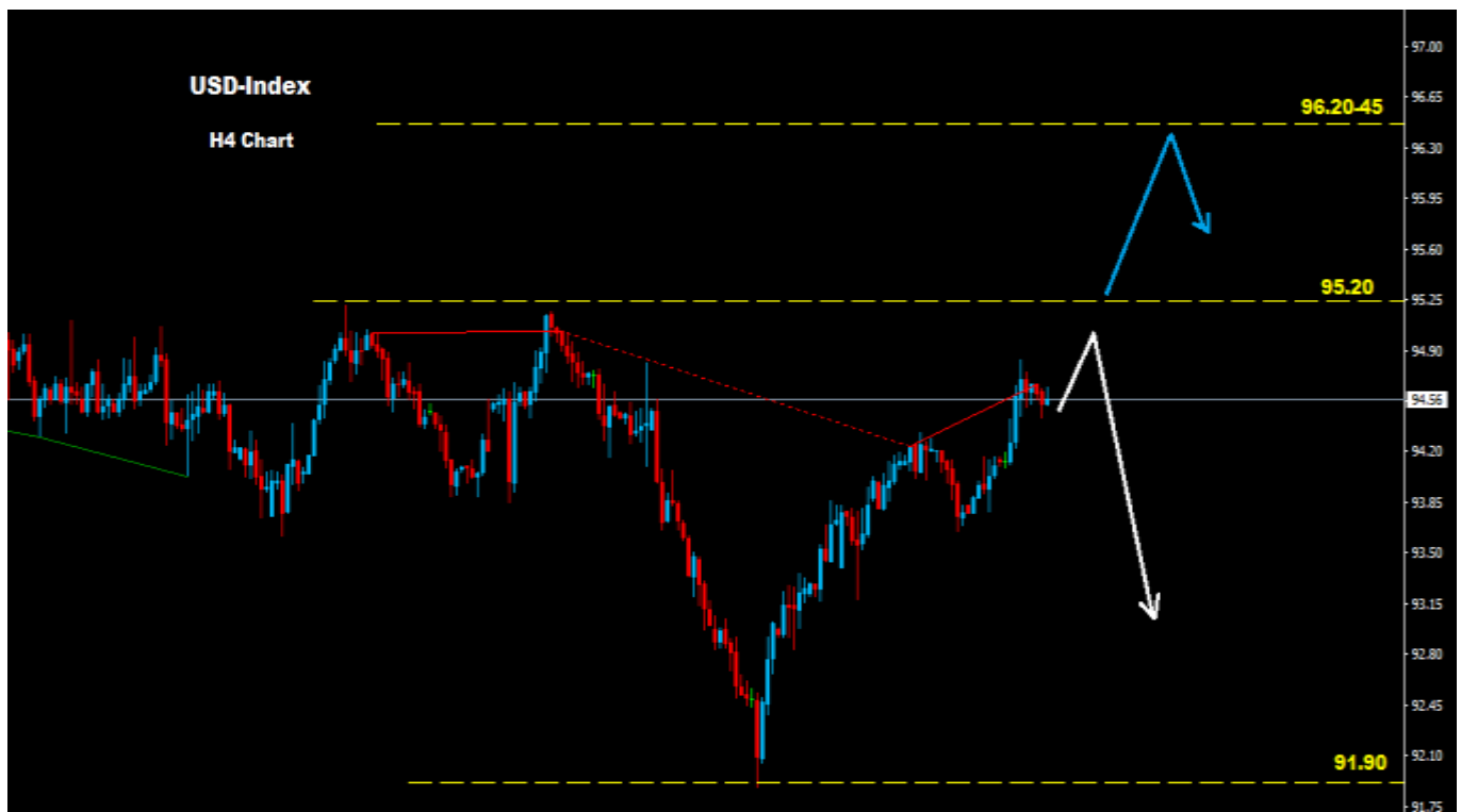
مؤشر الدولار - الإطار الزمني 1 ساعة

توجهات مؤشر الدولار قد تعتمد بشكل كبير على ارقام التضخم على الاقتصاد الأمريكي لهذا الأسبوع .