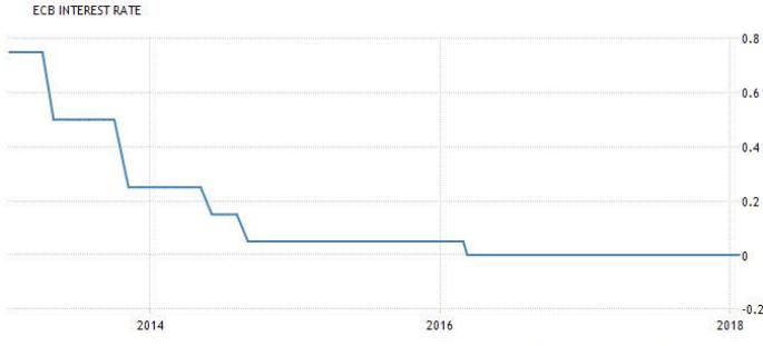
معدل سعر الفائدة من البنك المركزي الأوروبي

البنك المركزي الأوروبي يبقي سياسته النقدية دون تغيير في 25 يناير, وذلك بعد أن حافظ البنك المركزي الأوروبي على معدل سعر الفائدة عند (0.00%) نفس توقعات السوق. أكد أيضاً أن صافي برنامج شراء السندات من المقرر أن يتم تنفيذه بوتيرة شهرية تبلغ 30 مليار يورو بداية من الشهر الجاري حتى نهاية سبتمبر أو ما بعد ذلك إذا لزم الأمر.