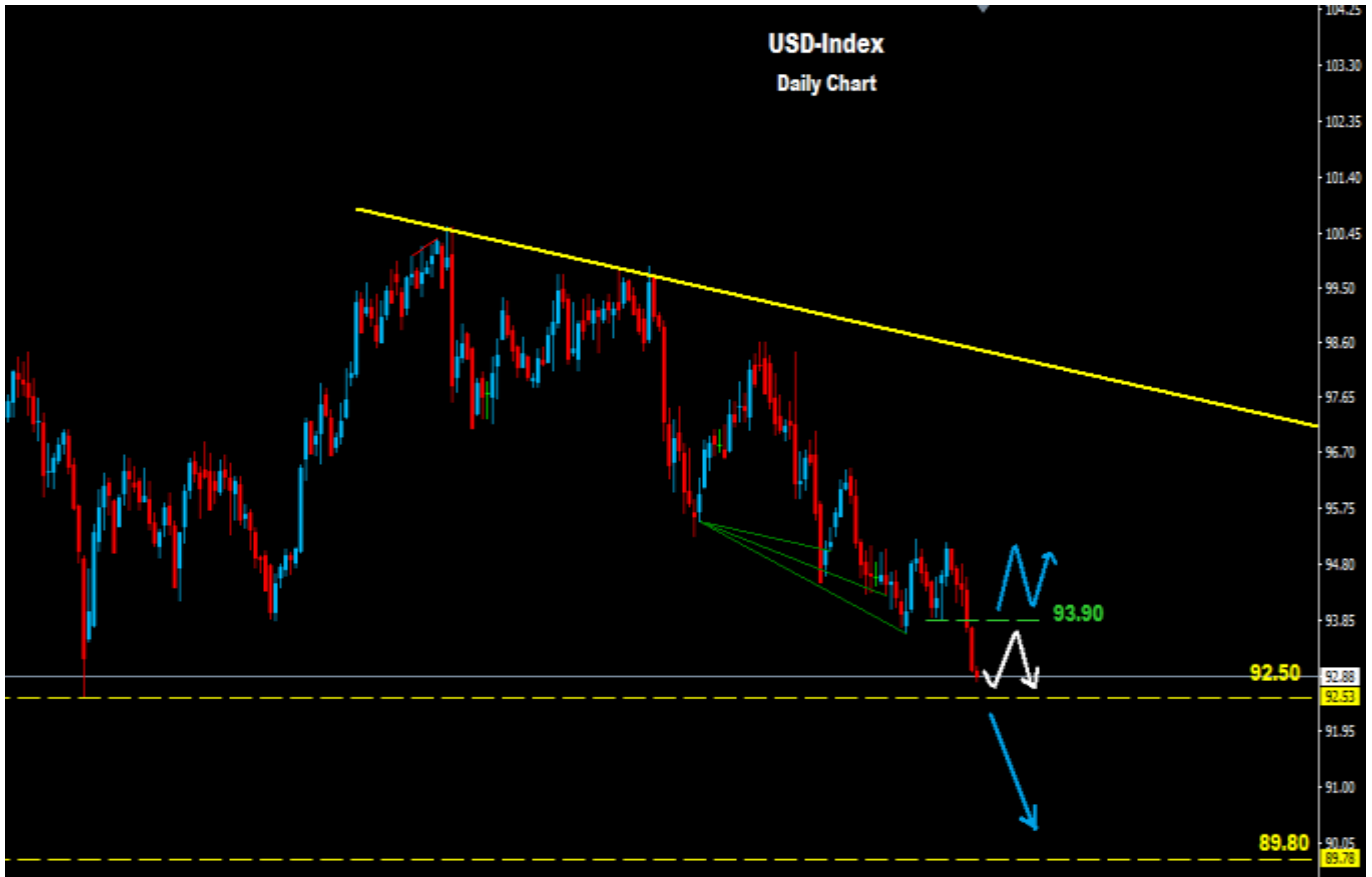
مؤشر الدولار - الإطار الزمني يومي

أي اختراق تحت مستويات (92.50) سيضع السوق ضمن نطاق موجه هابطه ستستهدف مستويات منطقة (89.80)