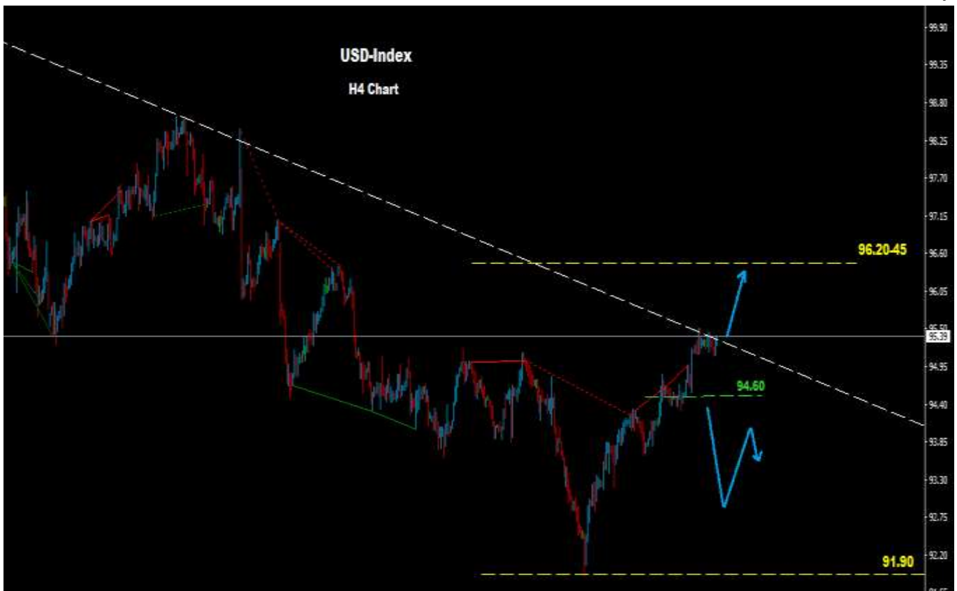
مؤشر الدولار - الإطار الزمني 4 ساعة

من جهة أخرى واذا ما تمكن السوق من الهبوط تحت مستويات (94.60) فان موجة هابطة تصحيحية قد تضرب السوق باتجاه مستويات (92.50-60)